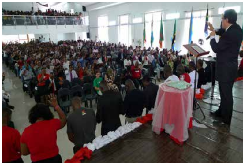
Cruzada de Milagres, Alto Maé (Moçambique)

Tratam-se de reuniões realizadas pelos principais líderes de cada nação, regional e são de carácter evangelístico.