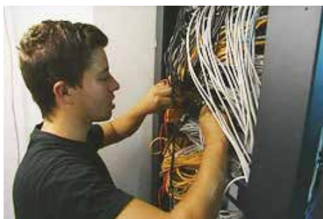
Departamento de Informática