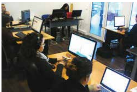
Departamento de Traduções