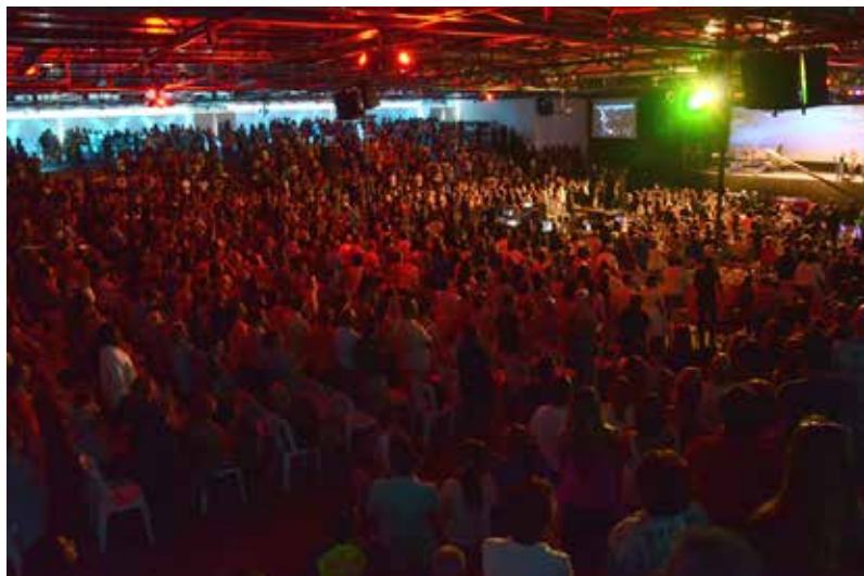
Pavilhão principal na Sede Internacional

Neste espaço são realizados grandes eventos (Convenções, Seminários, Campanhas, etc.).