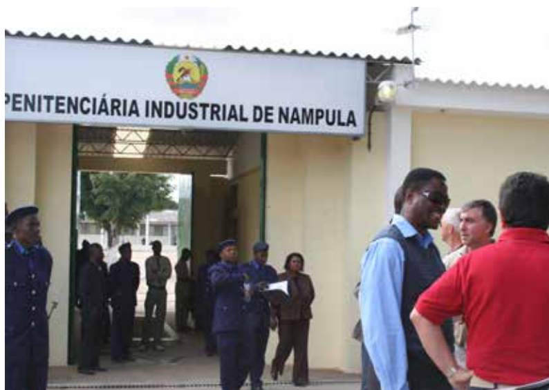
Trabalho Social em Penitenciária (Moçambique)