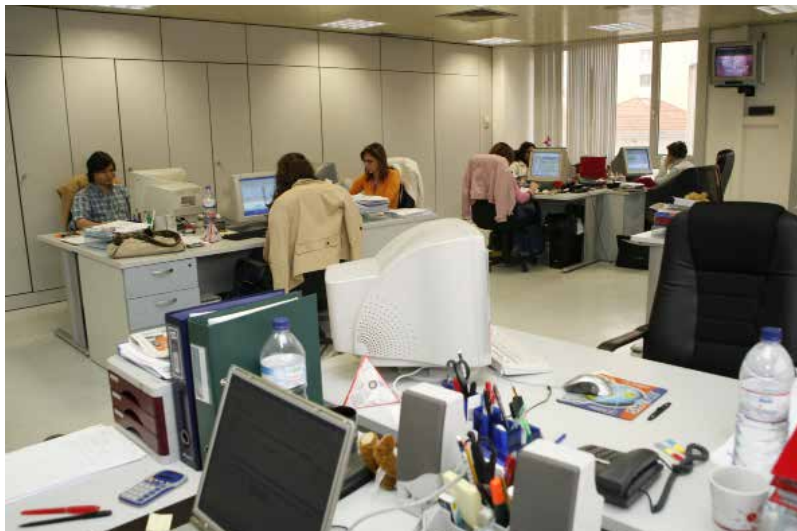
Administração Internacional, Alvalade - Lisboa, Portugal

Com a expansão do Grupo Maná e para responder às suas necessidades, foram realizados novos investimentos, ampliando a infraestrutura da sede da Administração Internacional.