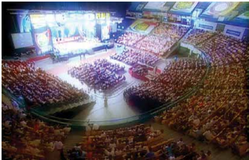
Convenção de Fé 2004, Pavilhão Atlântico - Lisboa (Portugal)