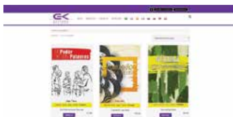
Site kuriakos Editora