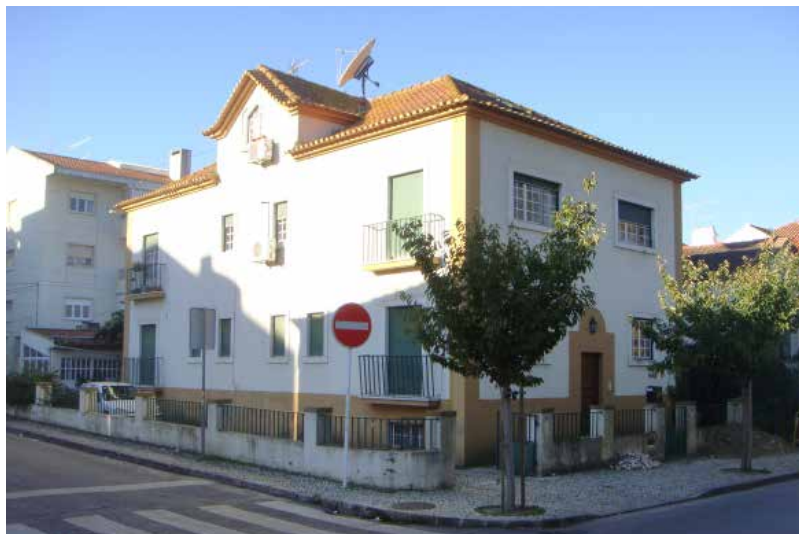
Primeira Administração Internacional, Loures - Lisboa, Portugal

Com o crescimento do grupo, a demanda de espaço físico tornou-se maior, sendo a sede transferida em 2004 para novas instalações sitas em Alvalade, Lisboa.