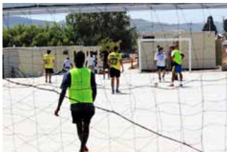
Complexo Desportivo e de Lazer