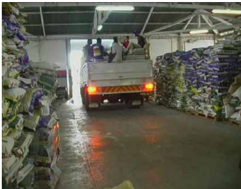
Alimentos para distribuição