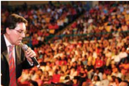
Convenção de Fé 2004, Pavilhão Atlântico - Lisboa (Portugal)