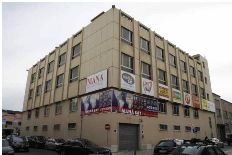
Administração Internacional, Alvalade - Lisboa, Portugal