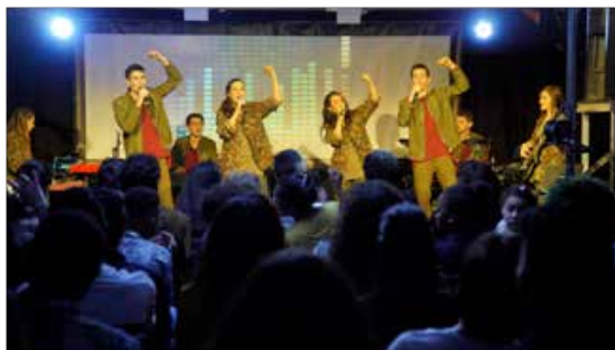
Banda do Team Kuriakos