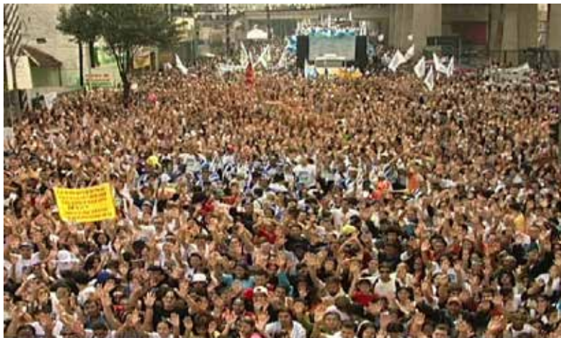
Marcha para Jesus, São Paulo (Brasil) 1 milhão de pessoas