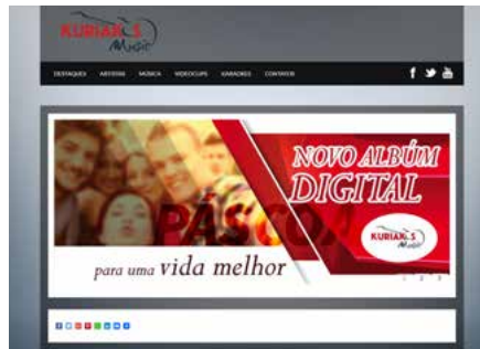
Página do site Kuriakos