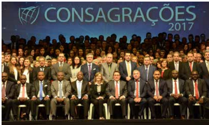
Consagrações Anuais Portugal 2017

Todos os anos a liderança do Grupo Maná, constituída por Bispos, Pastores, Presbíteros, Missionários e Diáconos é consagrada numa cerimónia oficial.