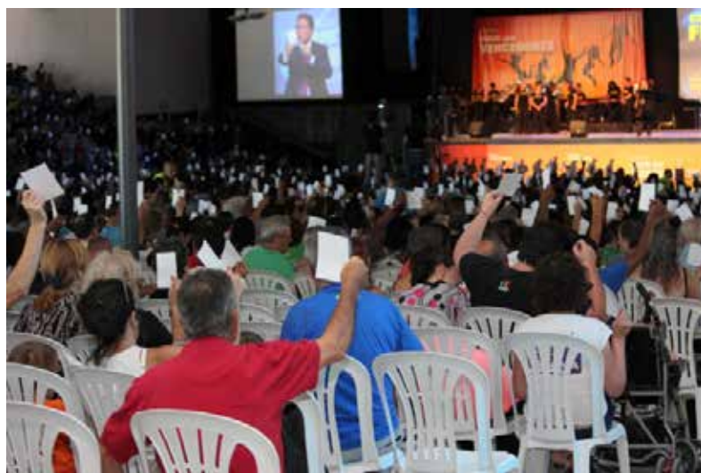
Convenção de Fé 2013, Tojal (Portugal)