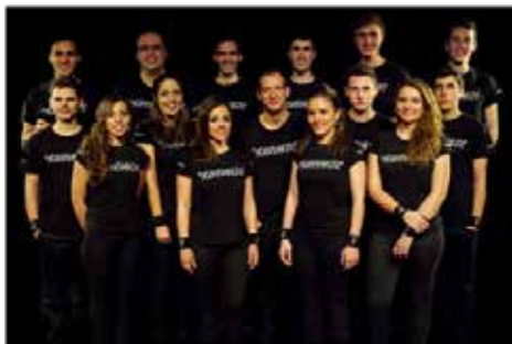
Equipe Técnica e Banda do Team Kuriakos

As várias tournées já foram visionadas por dezenas de milhares de pessoas em mais de uma dezena de países e em dois continentes (Europa e África).