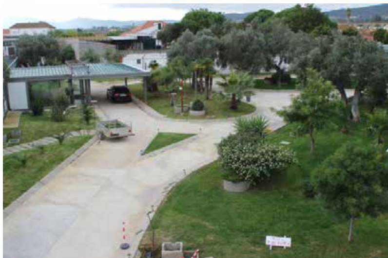
Entrada da Atual Adm. Internacional, Tojal (Portugal)