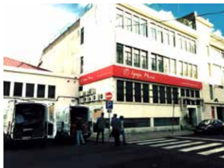
Portugal (Sede de Liboa-Alvalade)