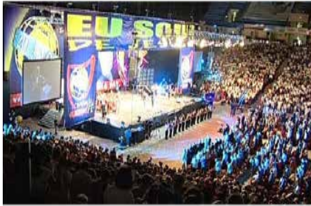
Convenção de Fé 2004, Pavilhão Atlântico - Lisboa (Portugal)