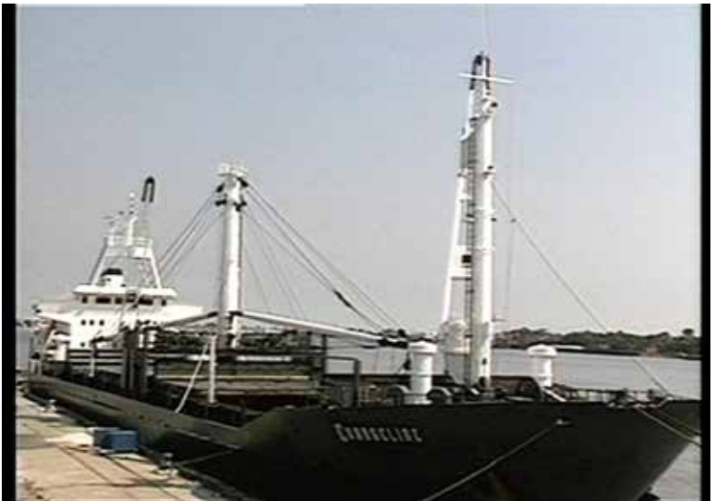
Barco de Distribuição de Alimentos (Populações necessitadas em África)