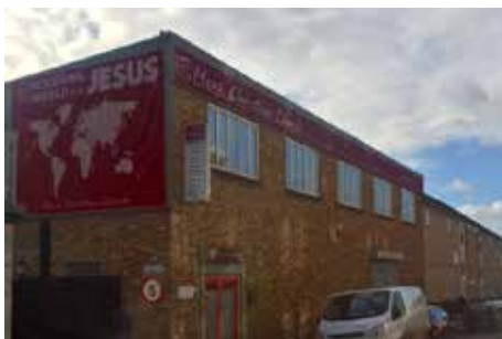
Inglaterra (Sede de Londres)