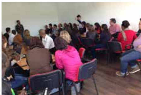
Centro Internacional de Missões