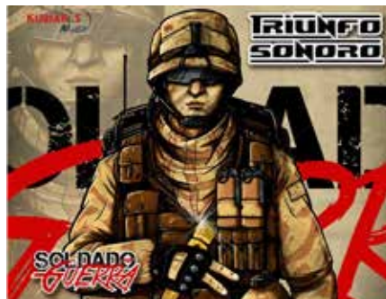
Álbúm disponível na Kuriakos Music