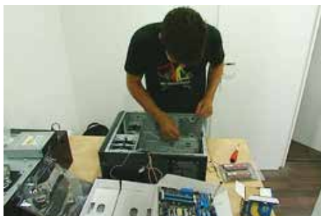
Departamento de Informática