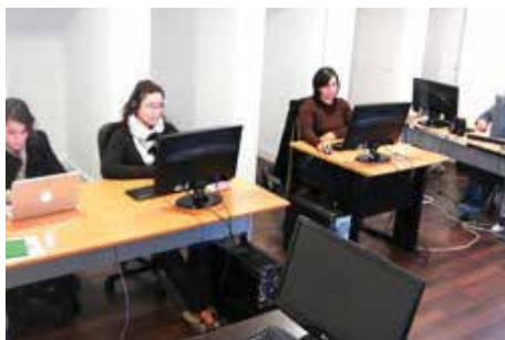
Departamento de Traduções