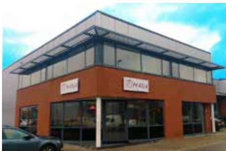
Holanda (Sede de Roterdão)