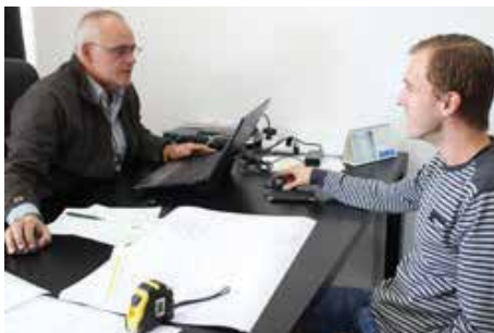
Departamento de Engenharia e Arquitectura