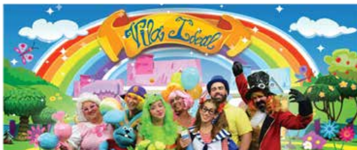
Personagens da Vila Ideal

No final tudo acaba em Vitória! VILA IDEAL, ONDE TU ÉS ESPECIAL!