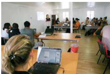
Centro Internacional de Missões