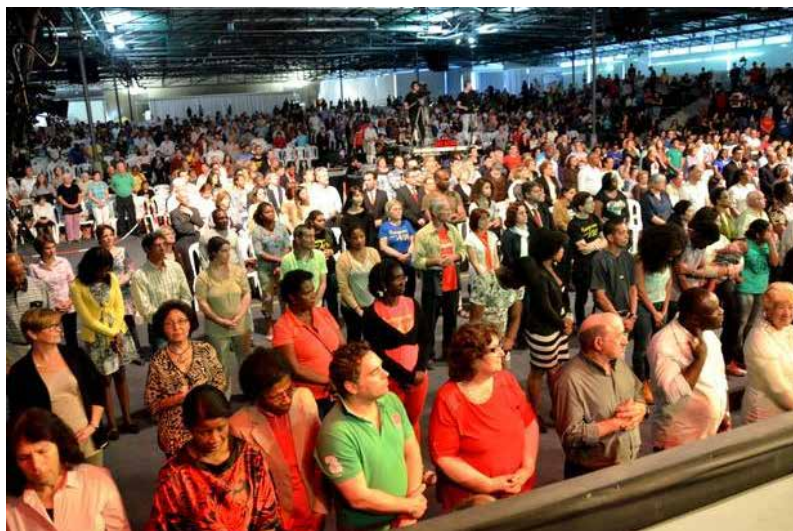
Pavilhão principal na Sede Internacional