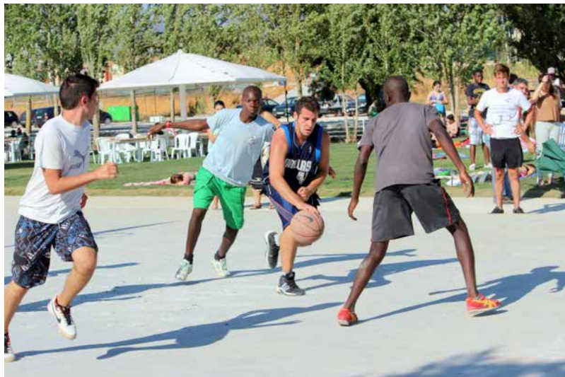
Complexo Desportivo e de Lazer