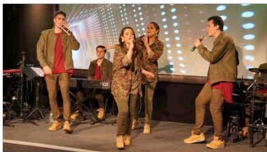
Banda do Team Kuriakos