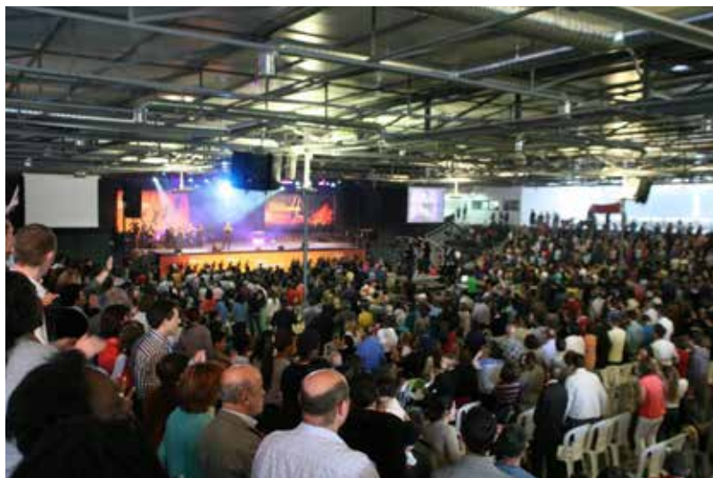
Campanha de Oração, Tojal (Portugal)

Em Portugal a Campanha termina com um encontro de todas as igrejas no Pavilhão da Sede Internacional no Tojal, Loures para uma reunião de encerramento.