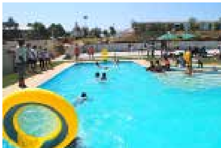
Complexo Desportivo e de Lazer