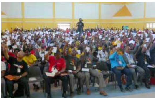
Cruzada de Milagres, Oshakati (Namíbia)