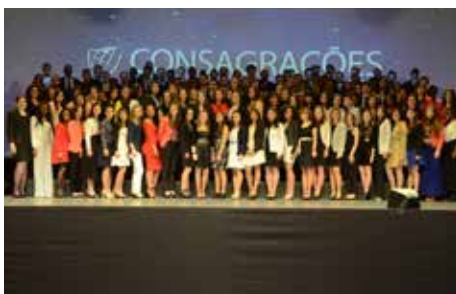
Grupo de Missionários 2017 em Portugal