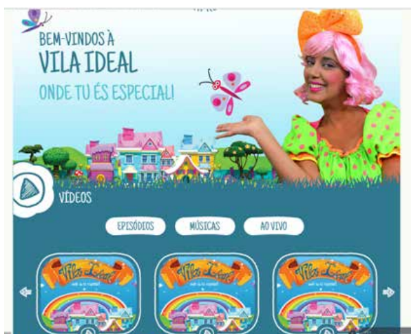
Site da Vila Ideal