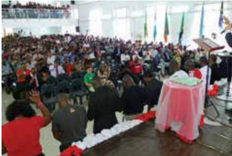
Moçambique (Sede de Alto Maé)