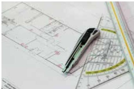
Departamento de Engenharia e Arquitectura