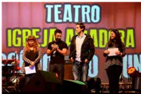
Festival de Talentos