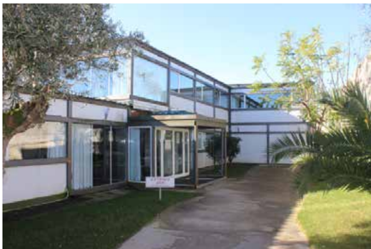
Entrada da Atual Adm. Internacional, Tojal (Portugal)