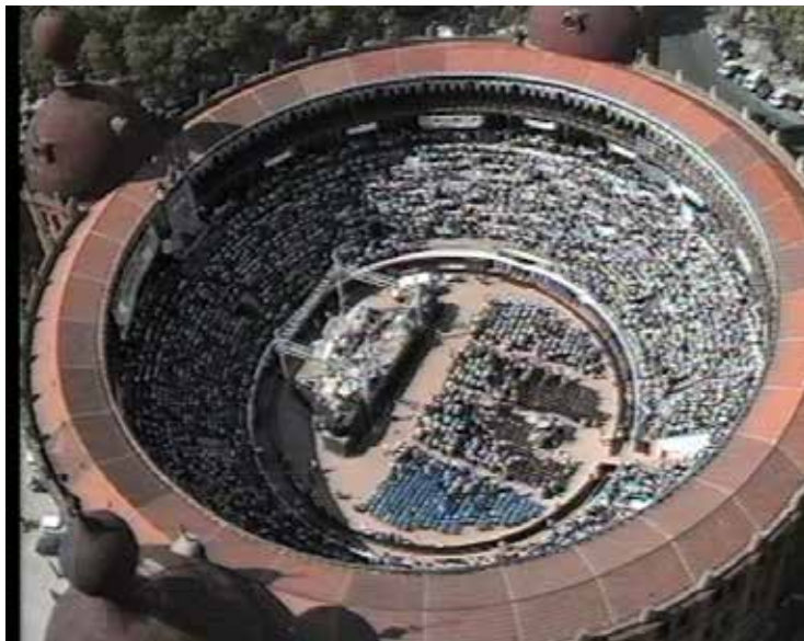
Convenção de Fé, Campo Pequeno - Lisboa (Portugal)