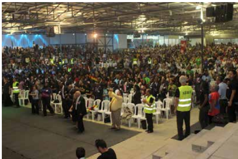
Convenção de Fé 2013, Tojal (Portugal)