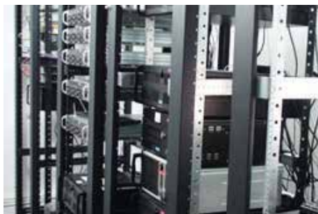
Departamento de Informática