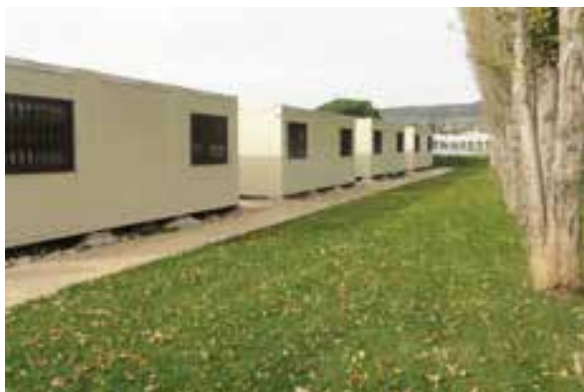
Casas para Hospedagem