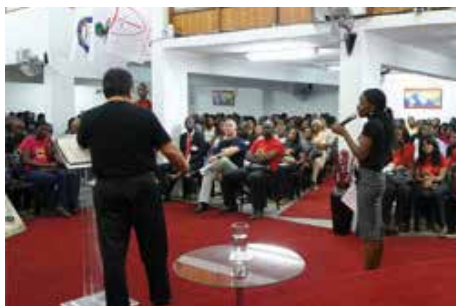
Namibia (Sede de Windhoek)