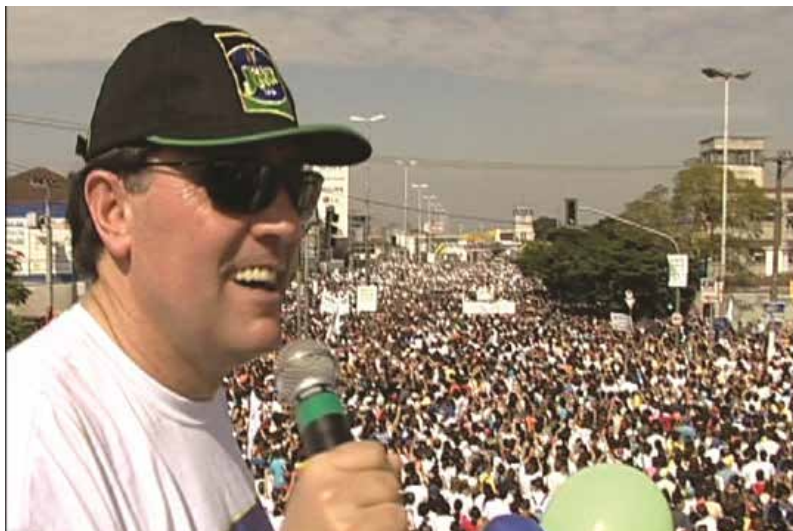
Marcha para Jesus, São Paulo (Brasil) 1 milhão de pessoas

A Igreja Maná participa ativamente, há anos, deste evento em parceria com outros ministérios.