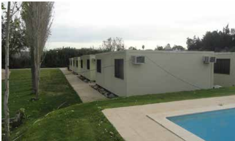
Casas para Hospedagem