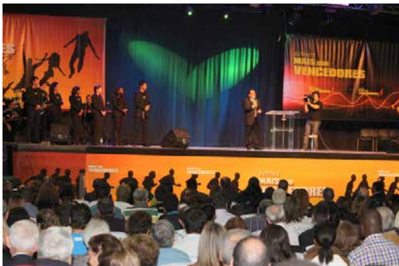
Reunião de Clube Executivo, Tojal (Portugal)