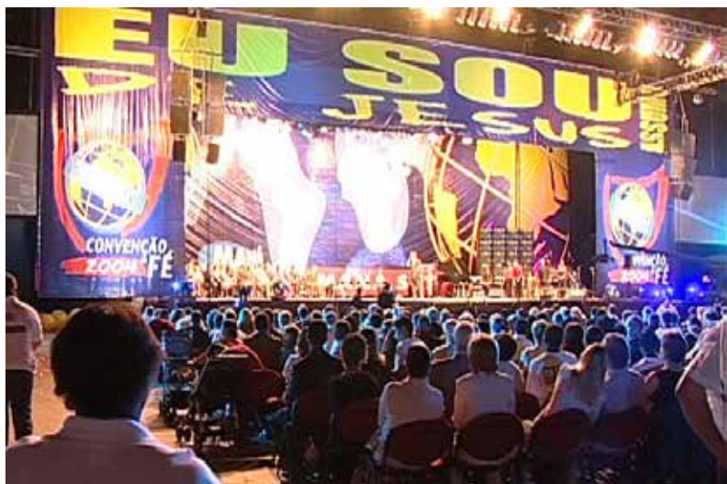
Convenção de Fé 2004, Pavilhão Atlântico - Lisboa (Portugal)