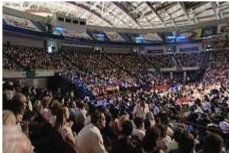
Convenção de Fé, Pavilhão Atlântico - Lisboa (Portugal)