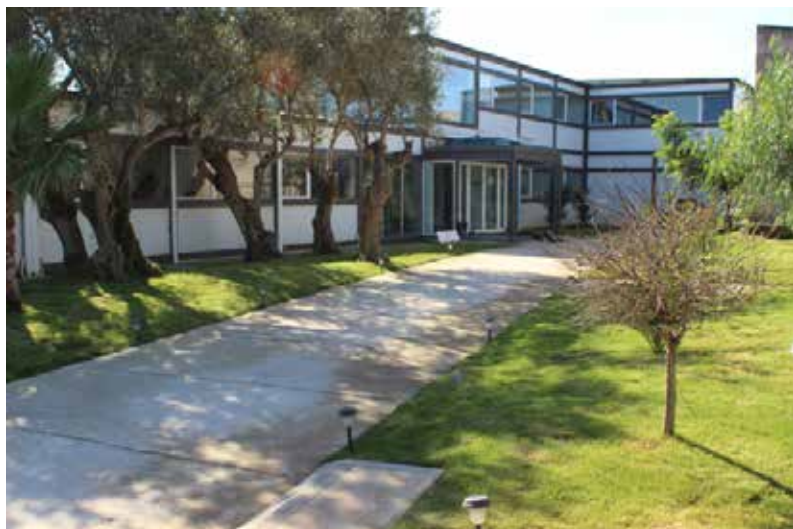
Entrada da Atual Adm. Internacional, Tojal (Portugal)