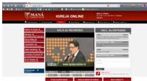
Site da Igreja online