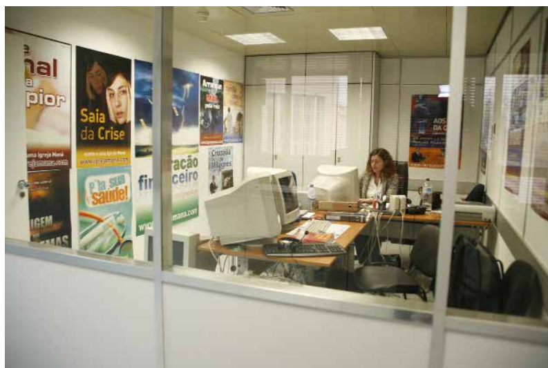
Administração Internacional, Alvalade - Lisboa, Portugal