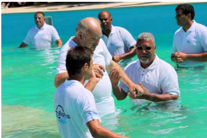
Batismos nas Águas, Tojal (Portugal)