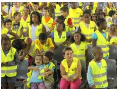
Igreja Infantil durante eventos

É também utilizado para receber as crianças quando se realizam grandes eventos nestas instalações.