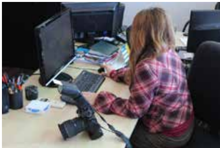
Departamento de Marketing e Design