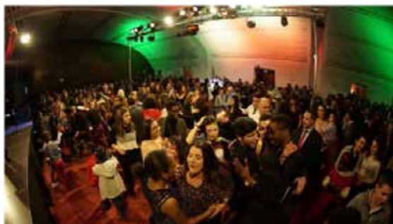
Público de uma das Tournées