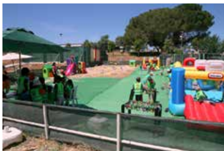
Espaço de Recreação para Crianças