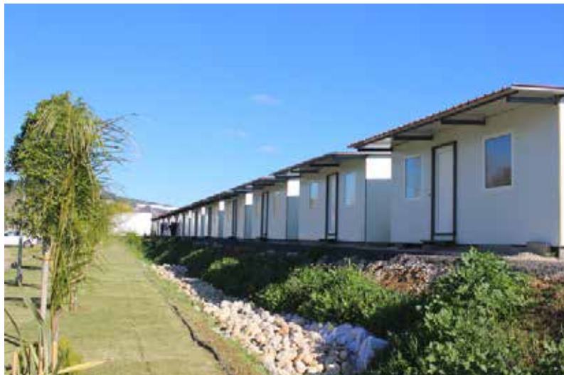
Casas para Hospedagem

O projeto e construção desta infraestrutura contou com o trabalho de profissionais altamente qualificados, tais como engenheiros, arquitetos, manobreadores de máquinas, construtores civis, chefes de obra, bem como com a ajuda voluntária de colaboradores e missionários.