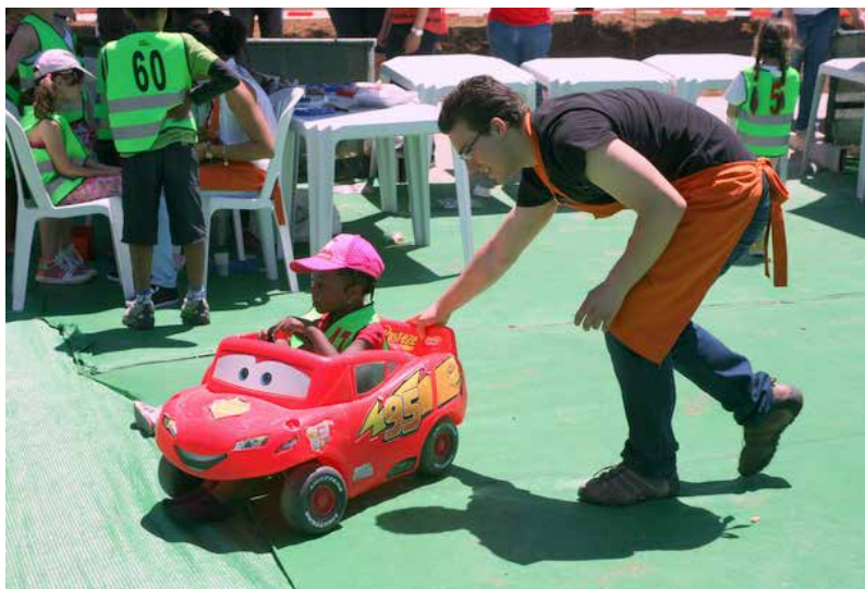
Espaço de Recreação para Crianças