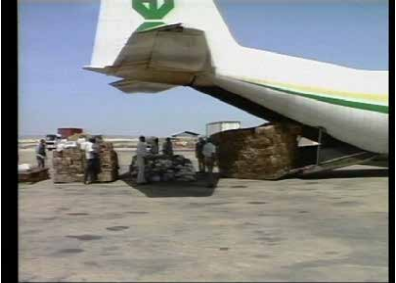
Avião para Distribuição de Alimentos