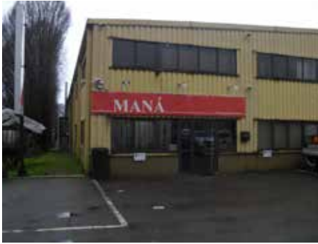
Luxemburgo (Sede de Howald)