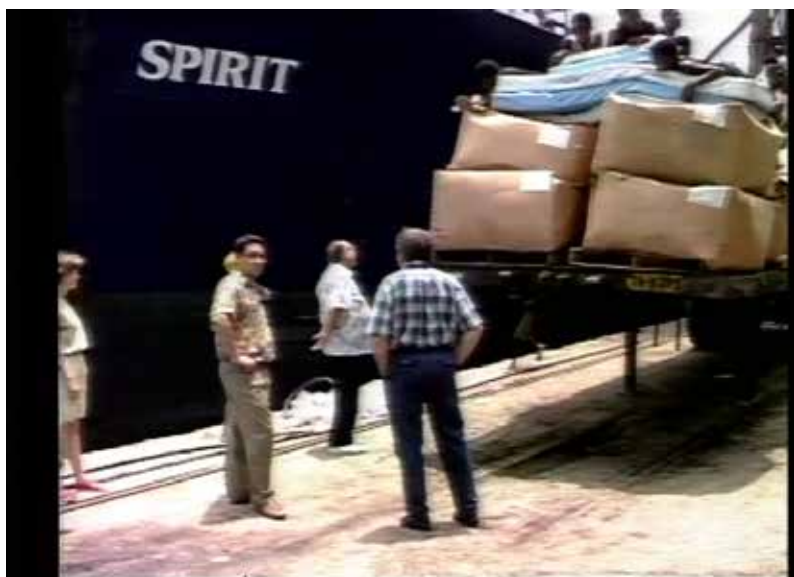
Distribuição de Alimentos