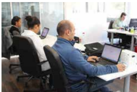
Gabinetes da Sede Internacional