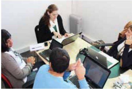
Departamento de Escola Bíblica