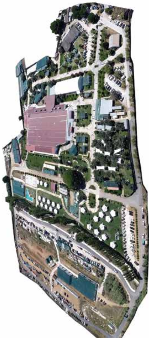
Sede Internacional, Tojal (Portugal)