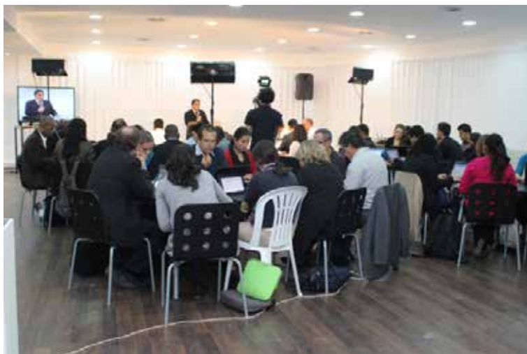
Sala de reuniões e treinamento na Sede Internacional