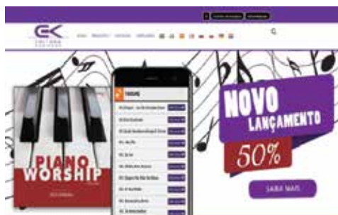
Site kuriakos Editora