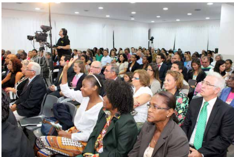
Reunião de Clube Executivo, Tojal (Portugal)