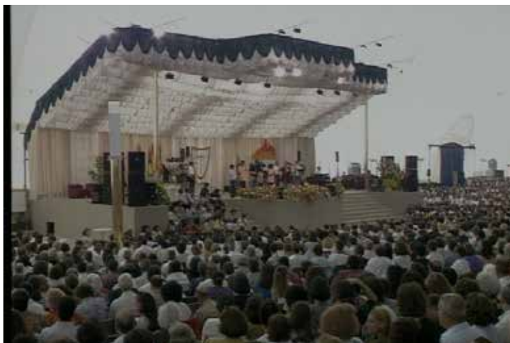
Convenção de Fé, Instalações Antigas do Tojal (Portugal)