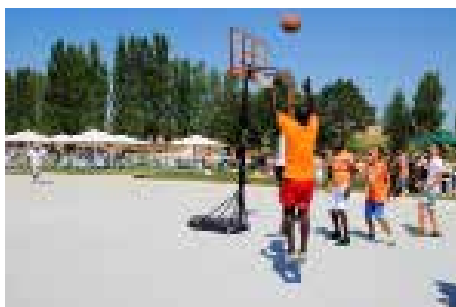
Complexo Desportivo e de Lazer