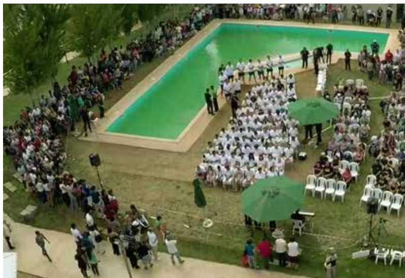
Batismos nas Águas, Tojal (Portugal)