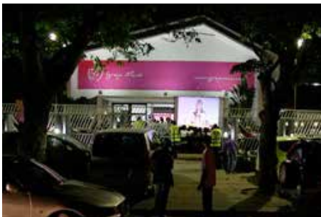
Moçambique (Sede de Alto Maé)