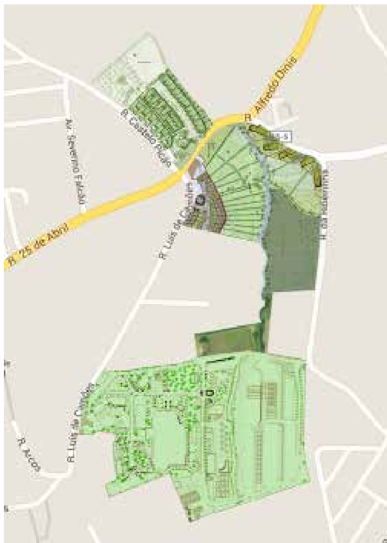
Sede Internacional, Tojal (Portugal)